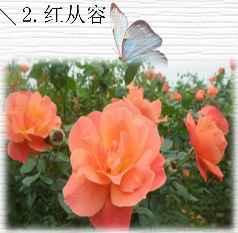
红从容 ( Red Velvet )