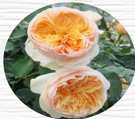
中国黄色茶香月季 (PARKS YELLOW TEA- SCENTED CHIAN)