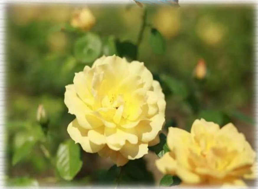
黄从容 ( Yellow Leisure Liness )