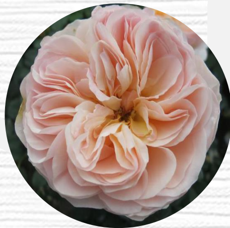
中国绯红茶香月季 (HUME'S BLUSH TEA-SCENTED CHINA)