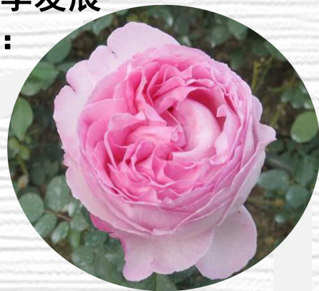
柏氏中国粉 (RARSON'S PINK CHINA)