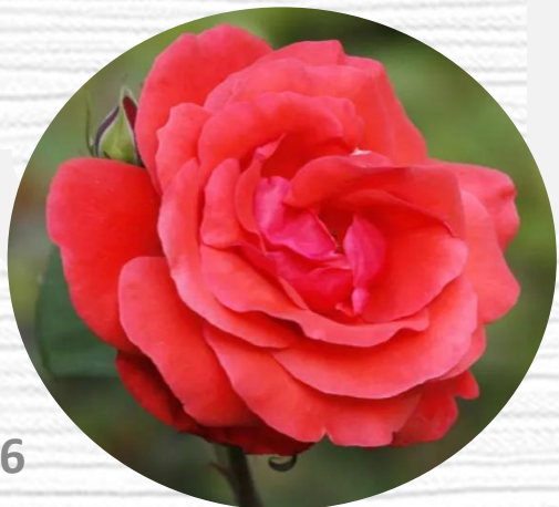
斯氏中国朱红 (SLATERS CRIMSON CHINA)