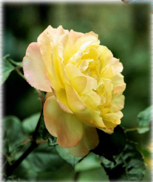
月季的起源与传播